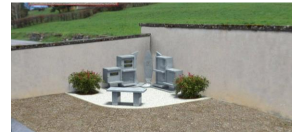
Simulation de l'insertion du projet

L'Entreprise Granimond de St Avold, va installer (dans l'angle amont gauche) un columbarium pour 6 familles. (coût du chantier 4 101 € TTC). Nous n'avons pas encore statué sur les coûts des concessions et nous vous transmettrons ces informations dès que possible.