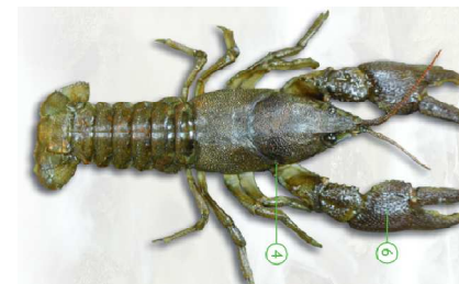
Pattes blanches (la face interne des pinces est blanche)