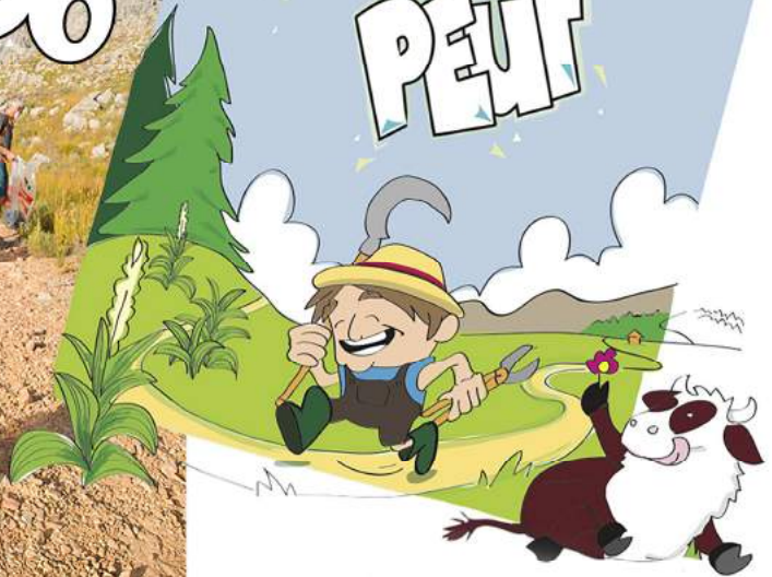
Chantier de coupe de Vétratre sur l'alpage

Organisés par Décathlon Grésy sur Aix, Bauges Evasion, le Parc du Massif des Bauges et les Randonneurs du Chéran